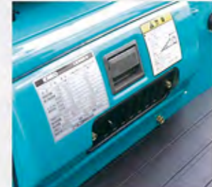
ヒータ&デフロスタ