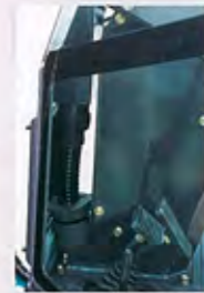
ヒータ&デフロスタ