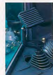
足踏み式パーキングブレーキ