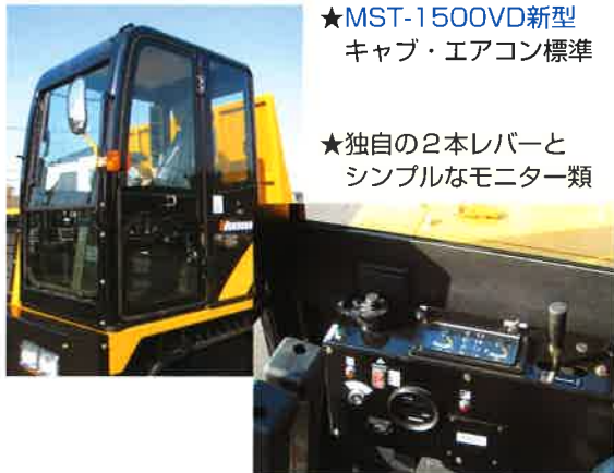
★MST-1500VD新型 キャブ・エアコン標準