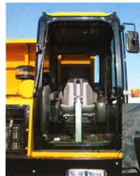
★MST-2200VD新型 ★更に 視界性と居住性 を 重要視し、 安全で快適な 作業 ができます。