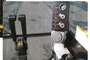
★好評な2本レバーと 充実したモニター類