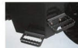
乗降用ステップ (V3は1段ステップ)