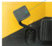
足踏み式パーキングブレーキ