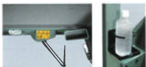
バックミラー&ルームライト ドリンクホルダー